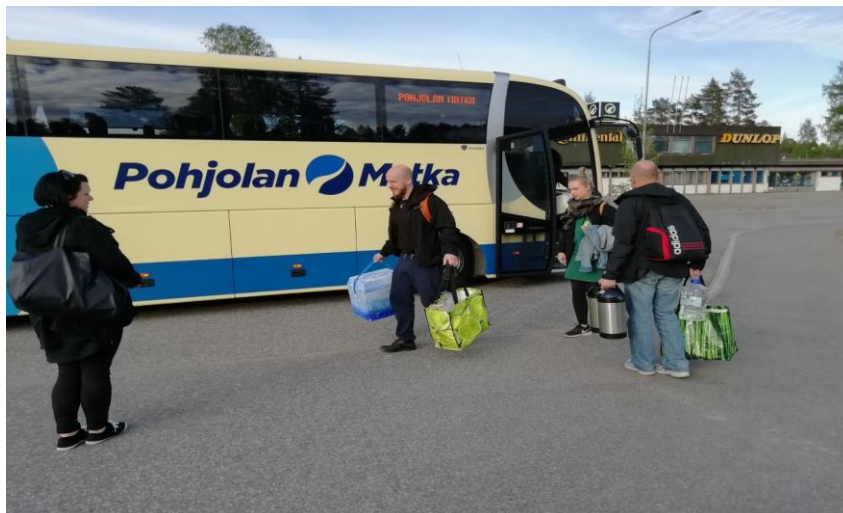
AVI:n Bussilla Ihanko Pihalla? -tapahtumaan Kouvolan Tykkimäkeen, toukokuu 2019

Nuorten kokonaisvaltaista hyvinvointia tuettiin monin tavoin: Taitoverstaan omien liikunta- ja virkistyspäivien lisäksi yhteistyötä jatkettiin Karelia Ammattikorkeakoulun Voimala-hyvinvointipalvelun kanssa. Taitoverstaan nuoret osallistuivat myös Joensuun kaupungin liikuntapalveluiden järjestämään Harrastepankki-toimintaan, jonka myötä nuoret pääsivät tutustumaan uusiin liikuntalajeihin. Lisäksi Taitoverstaalla järjestettiin yhteisiä virkistys- ja eräretkiä muun muassa Kuhasaloon ja Noljakan lintutornille. Etsivän nuorisotyön kanssa Taitoverstaan nuoria osallistui tänäkin vuonna Nuotta-valmennukseen.