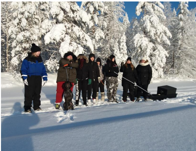
Etsivät ja nuoret Nuotta-valmennuksessa Metsäkartanolla, tammikuu 2019

Vuoden aikaan nuoria ohjautui muun muassa opintoihin, mielenterveys- ja päihdepalveluihin, liikunta- nuoriso- ja vapaa-ajan palveluihin, TE-toimiston työkokeiluun, ammatinvalinnanohjaukseen ja muihin työhön liittyviin toimenpiteisiin, avoimille työmarkkinoille, työpajalle, kuntouttavaan työtoimintaan, erilaisiin hankkeiden järjestämiin valmennuksiin sekä Kelan nuorten palveluihin, esimerkiksi Nuotti-valmennukseen ja kuntoutusselvityksiin. Lisäksi yhdessä Joensuun etsivän nuorisotyöntekijän kanssa järjestettiin vuoden 2019 aikana kaksi Nuotta-valmennusta, jotka molemmat toteutuivat Rautavaaran nuorisokeskuksessa Metsäkartanolla. Sovari-palautetta kerättiin Polvijärven etsivän nuorisotyön ohjauksessa olevilta nuorilta, joista kuntakohtainen tulosityhteen veto saadaan maaliskuussa 2020.