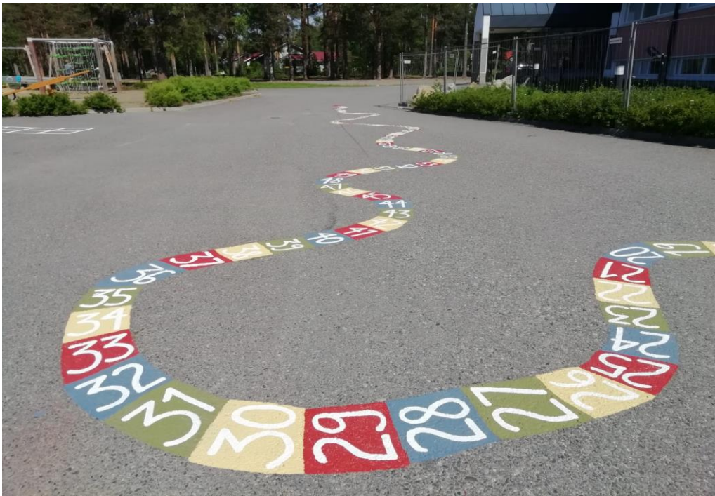
Taitoverstaan nuoret maalasivat pihapelejä Ylämyllyn koulun pihalle, kesäkuu 2019

tekeminen, puhdistus, maalaus ja listojen laitto. Työturvallisuus-/ensiapuseinän teko, muuttokouromien kuljetus, polkupyörien huolto sekä omien toimistotilojen tapetointi ja maalaus. Joulumyyjäisiin valmistettiin monenlaisia tuotteita. Suurimmat yksittäiset työurakat olivat Ylämyllyn koulujen leikkipaikkojen maalaus sekä verstaan keittiöremontti. Teknisellä verstaalla tehtiin vuoden aikana reilusti yli 100 erilaista tilaustyötehtävää.