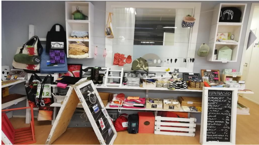
Nuorten tekemiä tuotteita, Taitoverstaan tuotemyymälä 2019