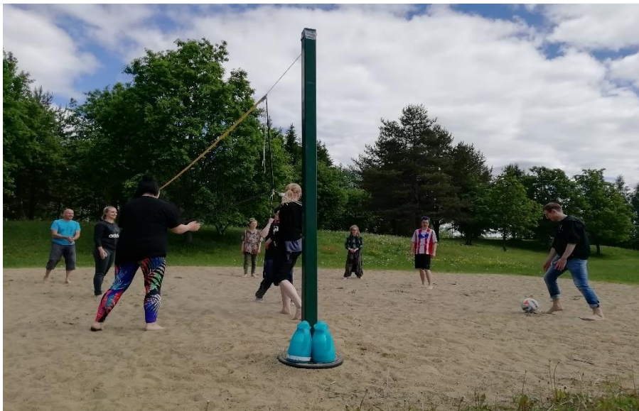
Taitoverstaan nuoret ja henkilökunta pelaamassa rantalentistä, heinäkuu 2019

Seuraavissa luvuissa tarkastellaan toiminnan sisältöä Joensuun Nuorisoverstas ry:n seudullisessa nuorten työpajatoiminnassa ja etsivässä nuorisotyössä, eriteltynä eri toimintoihin.