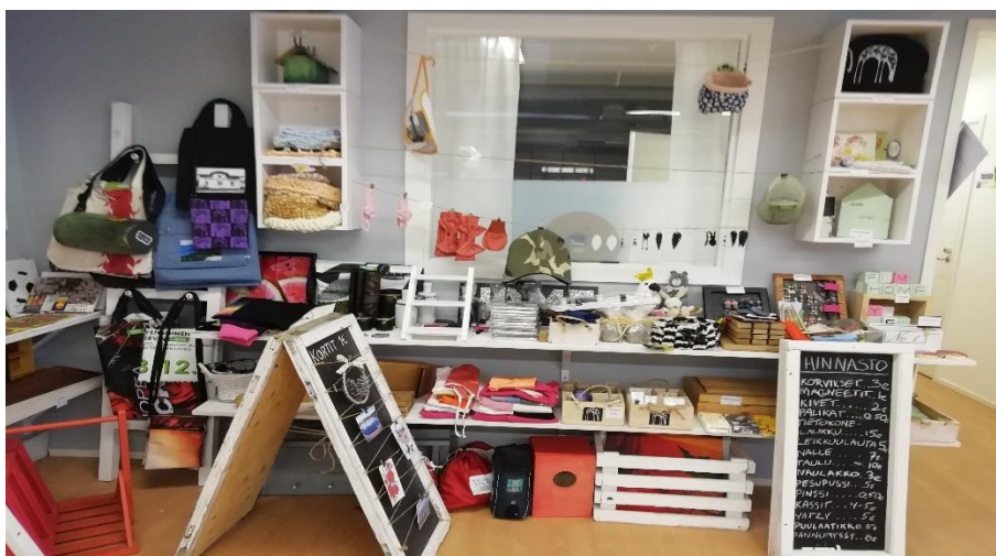
Nuorten tekemiä tuotteita, Taitoverstaan tuotemyymälä 2019

Yhdistyksellä on lisälmen Nuorison tuki ry kehittämiskumppanina. Toiminta tapahtuu vertaiskehittämisen keinoin. Kaiken kaikkiaan Nuorisoverstas teki vuoden mittaan yhteistyötä lukuisten yritysten, järjestöjen, yhteisöjen sekä oppilaitosten kanssa.